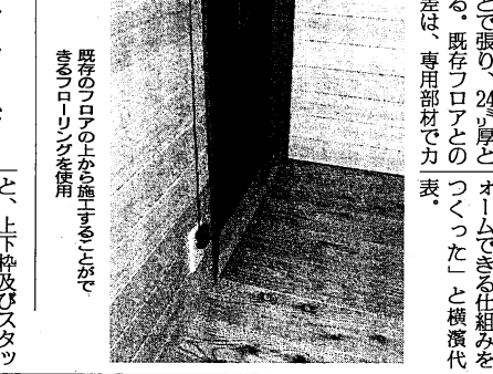
既存フロアの上から施工することで、ムクブローリングをテープ

かになって、地域の循環も良くなる(嶋田社長)と、地域材をふんだんに使った事務所を建てることを決めた。 「新築にありがちな嫌な臭いが全くない。居心地が良いので、こちらにいる時間が増えそう。職場環境もなり、仕事事ははかどるはず。」「働きやすい職場づくりへの取り組みの一環として事務所の完成を喜んでい