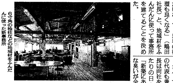
6寸角の柱柱などの地域材をふんだんに使った新事務所

のように一枚一枚固定してカットするのではなく、敷板まとめて連続カットすることで、傾斜をつけたカッターも可能。新たに設備されたランニングソーと今まで培ってきた加工技術 を、ムク材長尺カウンスター材や短尺のフロア加工、MDFやLVLなどエンジニアードウッドにも生かし、顧客の要望に応えていく。既存の枠や幅木はいじらずに簡単にリフォームできる仕組みをつくった」と横濱代表は、専用部材で発表。